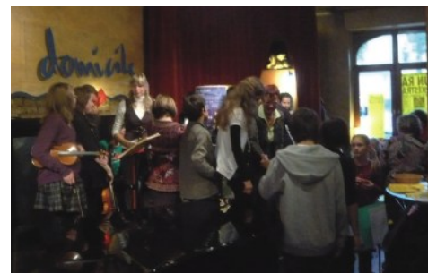
Volles Haus im Pforzheimer Jazzclub Domicile: Kinder und Jugendliche zwischen 3 und 20 Jahren sorgten für ein vielfältiges Programm.