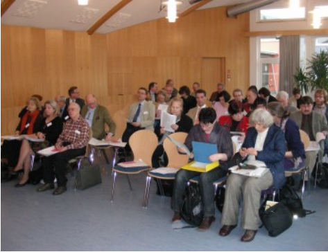
Bundesdelegiertenversammlung 2009 in Jena