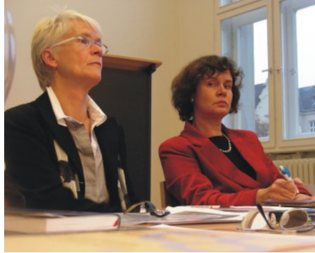
Länderkonferenz 2009 in Berlin