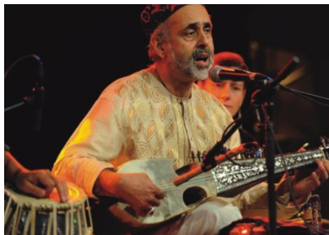
Daud Khan Sadozai, Meister der Rabab, einer orientalischen Langhalslaute.

Am Samstag, dem 27. März 2010, veranstaltet der Regionalverband Donau-Oberschwaben im Johannes-Zwick-Haus in Riedlingen/Donau ein Konzert mit Daud Khan Sadozai, einem der versiertesten und bekanntesten Interpreten nordindischer und afghanischer Musik in Europa.