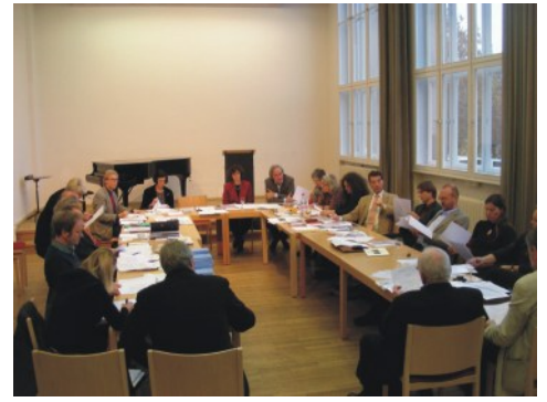
Das Plenum der Länderkonferenz 2009

Zusätzlich ist es in Zeiten der Finanzkrise wichtig, den Kontakt zu Politik und Wirtschaft auszubauen, aber auch zu beobachten, ob und welche Förderprogramme es in den einzelnen Ländern gibt und wie sie erreichbar sind. Ebenso notwendig ist die Darstellung der kommenden KSK Ausgleichsvereinigung für betroffene Kollegen. Zu diesen und anderen Themen ist es erforderlich, dass die Landesvertreter zusammenkommen, um sich auszutauschen und Ideen zu entwickeln. So haben wir beschlossen, uns am Rande der Bundesdelegiertenkonferenz in Essen am 6. März 2010 zu treffen und erste Schritte zu planen, die den Stand der privaten Musikschulen/Musikerzieher stärken können.