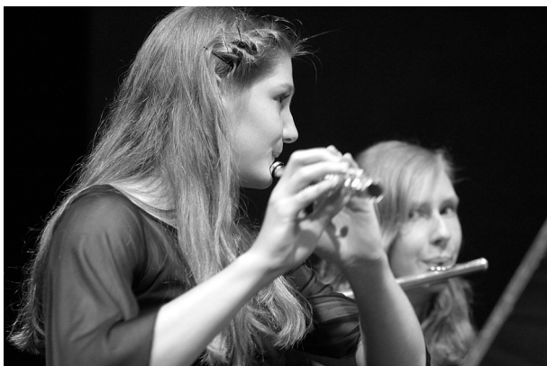
Boten ein starkes Konzert: Teilnehmer beim Workshop „Musik aktiv“