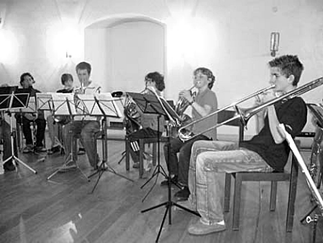
Spielen im Schloss auf der Musikfreizeit 2006

Auch schon bestehende Ensembles können teilnehmen. Thema ist die Welt der italienischen Musik.