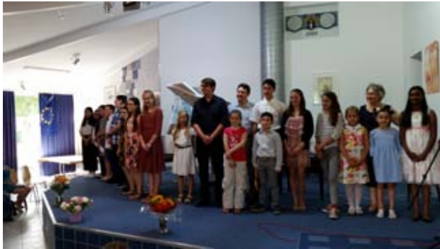
Die stolzen Teilnehmerinnen und Teilnehmer des Sommerkonzerts.